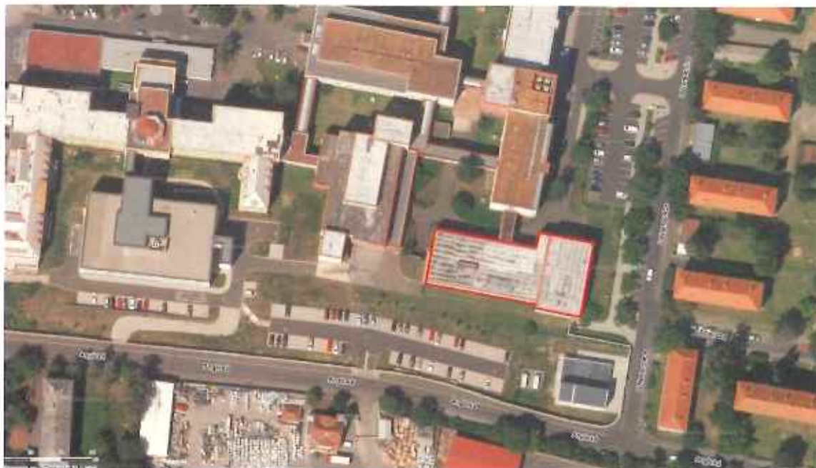
Obrázek 1 – Satelitní snímek posuzovaného objektu v rámci areálu